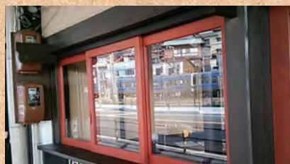
テイクアウトコーナー