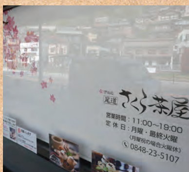
オリジナルロールスクリーン

うちの娘！とろけるわらび餅！大好きっす！これからもお力になれるよう、やったるで！