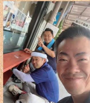
折りたたみ式ベンチ

そうそう、さくら茶屋のテイクアウトコーナーを作らせて頂いたのが、最初のお仕事でした。