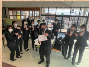
新人たち、カープラで輝け！