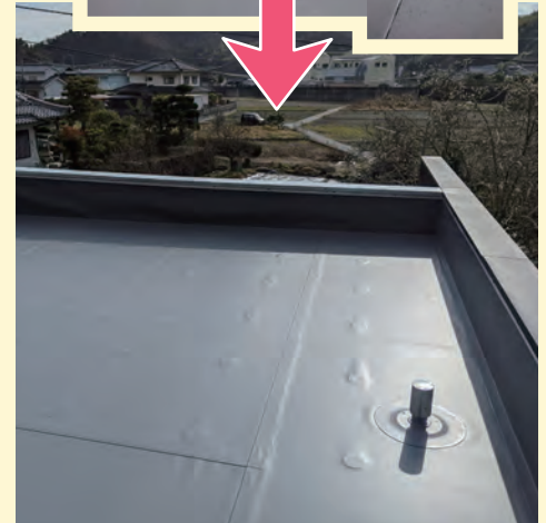
K様邸陸屋根 シート防水で修繕