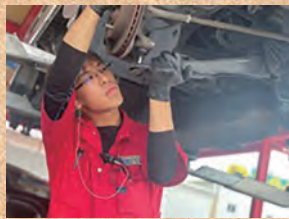
ありがとうの為に！