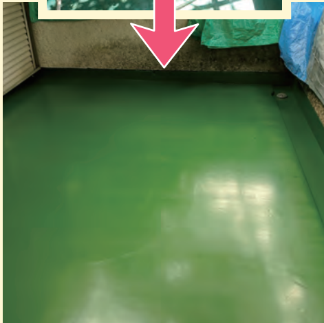
N様邸のベランダ シート防水で修繕 ウレタン防水で修繕