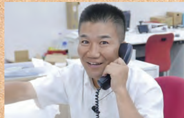
燃える闘魂、アントニオ田頭社長