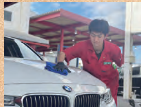
社長の想いを受け継ぎます！