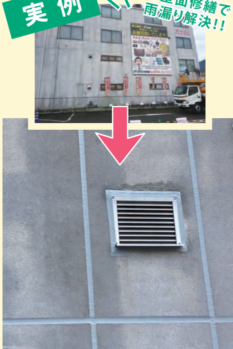
リバース竹原店様外壁 コーキングで修繕