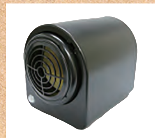
このような小型の機械を設置します。香りも選べるのです。

クリーニング工場が併設されています。外壁塗装でもお世話になりました。クールな感じに仕上がりました。感謝です！