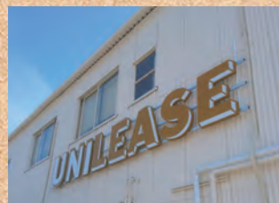
サイン工事もさせて頂きました。

クリーニング工場が併設されています。外壁塗装でもお世話になりました。クールな感じに仕上がりました。感謝です！