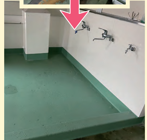
某工場（久山田） FRP防水+キッチンパネル施工