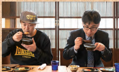
最終審査は、いっつくの山根社長と W 山根で!