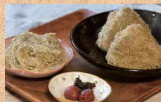
創業者のこだわりを受け継ぐのとろろこんぶ