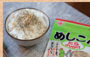
元祖ソフトふりかけめしこん