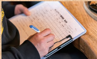
厳選なる審査の元、