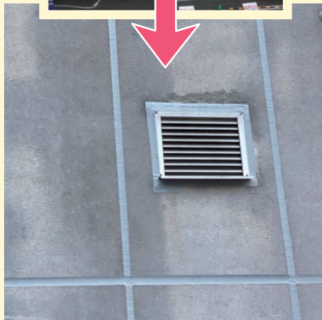
リバース竹原店様外壁 コーキングで修繕