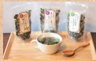
小坪お勤め、粘りと食感が楽しめるとろろスープ

工場にお伺いして、いつも感じる事……。生産が機械化されていても、やはり最後は、 人の手、人の温もり が味につながっていること……。スタッフの皆様のお力がお客様の喜びにつながっていると!