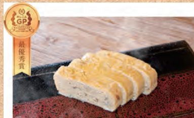
めしこんだし巻き卵!