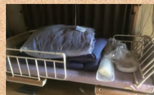
介護用ベッドの行先も確保して下さいました