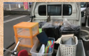
あっという間に買取して頂きました!