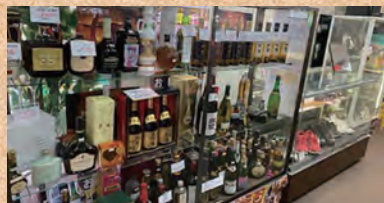
高級ウィスキーや、プレミアム焼酎!