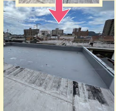
Y様陸屋根防水部分修繕 雨漏りの原因であるところを 徹底的に防水修繕