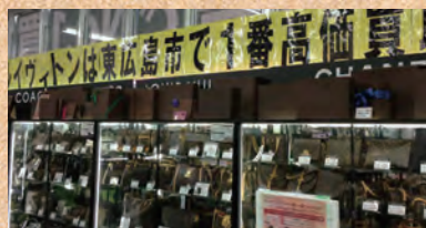
ブランド品コーナー発見!