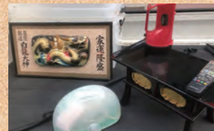
このような JAPAN を感じさせる商品、海外の方に人気なんですよ!