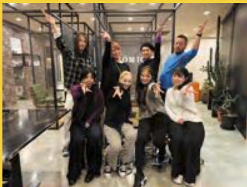
TAJISAS FAMILY with N