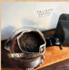
タジサス珈琲! おしゃれやん!

そして、そして、常に楽しい、そして、常に楽しむ、タジサスヘアーさん、こんな楽しいこともしてるんです! 「TAJISAS COFFEE」 に 「TAJISAS 有機野菜」 ですよ〜!まさに、みんなを喜ばせ!自分達も喜んで!人生、 enjoy! が伝わりますね!!本当に話題に事欠かなタジサスさんです!